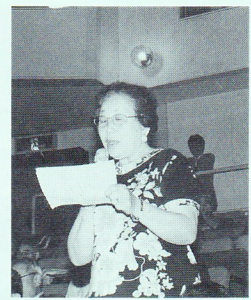
平成12年度金沢区「区民のつどい」が六月十七日(土)金沢公会堂