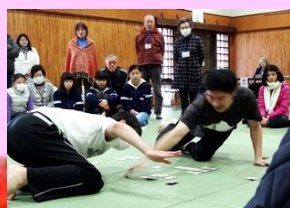
スピードと迫力の模範試合