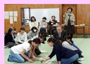
白熱の優勝決定戦