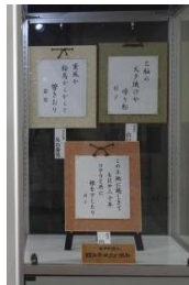
展示ケースで表彰作品を順次展示