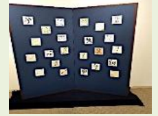
記念展に出品の小色紙合作

京急金沢八景駅隣接の権現山公園で、1月と7月に園企画の初心者向け「書道入門」講座を開催。1月は新年の賀句を、7月は七夕の短冊を書いて笹に吊るしました。地域の文化向上へ貢献でき、嬉しく思っています。