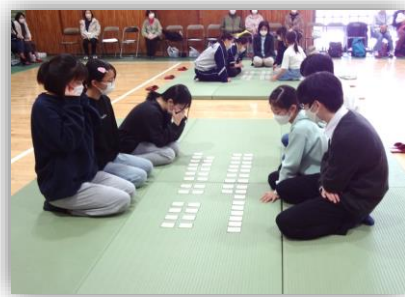
注目の優勝決定戦(手前)と3位決定戦