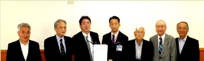
2回目の国と市へ署名簿提出(2023年4月27日、厚労省にて) 左から2名は文化協会、中央の左は厚労省、右は横浜市、 右の3名は顕彰会の代表者