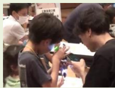
作った顕微鏡で観察