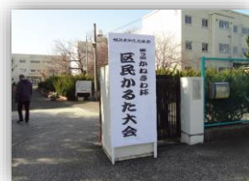
校門前におなじみの看板を設置しました