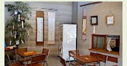
権現山公園休憩所で作品展示

京急金沢八景駅隣接の権現山公園で、1月と7月に園企画の初心者向け「書道入門」講座を開催。1月は新年の賀句を、7月は七夕の短冊を書いて笹に吊るしました。地域の文化向上へ貢献でき、嬉しく思っています。