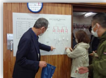
2回戦の組合せ抽選に視線集まる