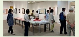
第35回記念展の様子

2023年6月29日(木)~7月4日(火)、杉田劇場ギャラリーで第35回記念金沢区書道協会展を開催。酷暑のためか入場者は例年の2割減でしたが、感染症対策も解け、本来の展示会が戻って来ました。記念展の取組みとして、全員による小色紙の合作を行ったところ、好評で「毎回行いたい」との意見も出しました。