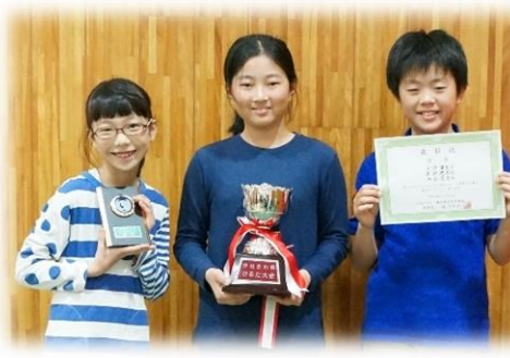
第2回 “並木第4小チーム”