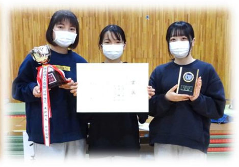
第3回 “たちばなチーム” (第1回の優勝姉妹。こんなにお姉さんになりました)