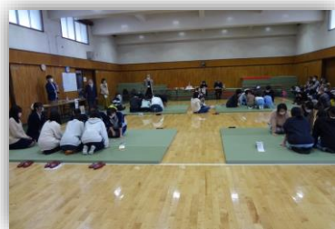
1回戦の熱き戦い始まる