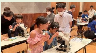
大学生の気持ちで顕微鏡をのぞく